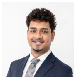
弁護士法人 御堂筋法律事務所

現在、インド最大手の法律事務所の一つ Shardul Amarchand Mangaldas & Co に出向し、日本企業のインド進出・コンプライアンス対応等を支援。インド法務に関する官公庁等のセミナー、執筆実績多数。ニューヨーク州弁護士。