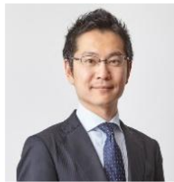
弁護士法人 御堂筋法律事務所

紛争解決法務を中心に、国際取引、コンプライアンス、競争法など、様々な分野において企業法務支援を行う。JETRO 新輸出大国エキスパート業務における法務エキスパートとして中小企業の海外進出支援などにも取り組む。ニューヨーク州弁護士。