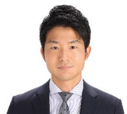
弁護士法人 御堂筋法律事務所

米国留学、シンガポールの法律事務所での勤務の経験を有し、国際取引、外国法コンプライアンス、国際紛争等の渉外法務分野に加え、M&A、データ・プライバシー、IT 分野を得意とする。データ・プライバシーに関する著作多数。