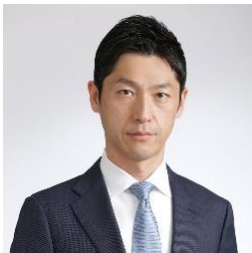
弁護士法人 御堂筋法律事務所